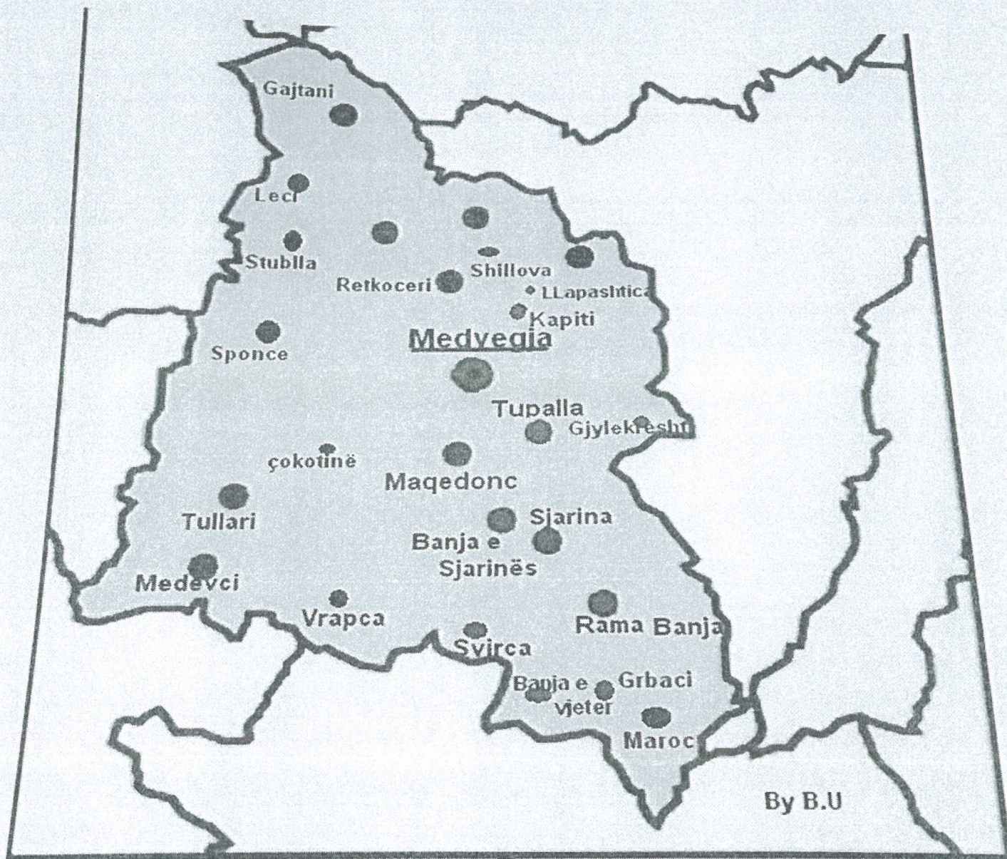
Harta 1. Harta e shpërndarjes së popullsisë në baza etnike, në komunën e Medvegjës 1