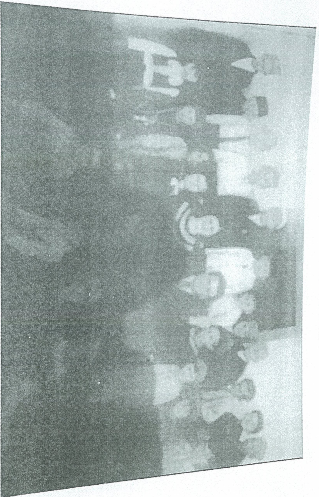
Foto 2. Fotografia me nxënësit serbë dhe Ishqiptar 1 cili dallohet për nga veshja kombëtare viti shkollorë 1945.