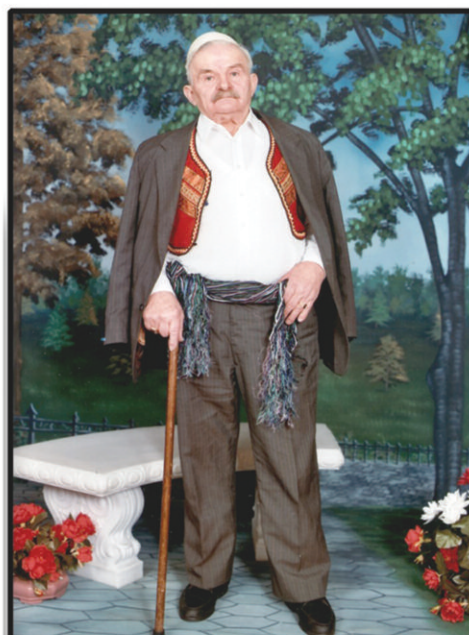
WW -II- Communist tortured survivor