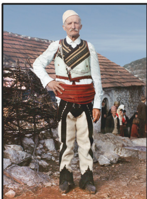
WW -II- Communist tortured survivor

Me rastin e 22-vjetorit të vdekjes së Kolë Mirit të Hotit Dedvukaj , i njoftun për qëndresë dhe për besë të dhanun.